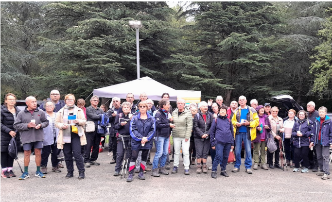
2 octobre - Marche Habitat Humanisme