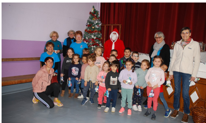
10 décembre - Éveil : visite du Père Noël