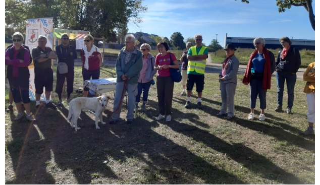
11 septembre - Boutons d'Art