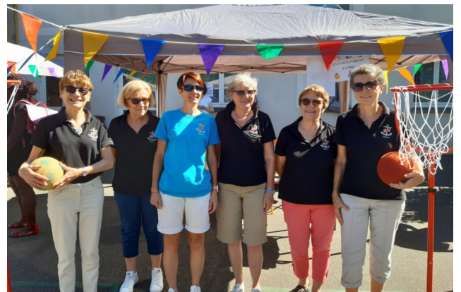
2 juillet - Kermesse NDC