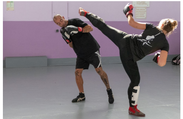
19 juin - Démonstration boxe française