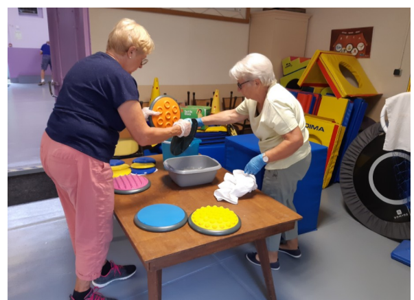
2 septembre - Nettoyage de la salle