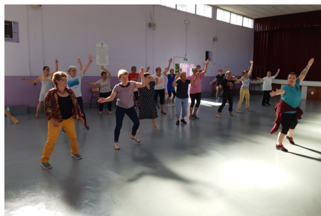
10 juin - Découverte Zumba