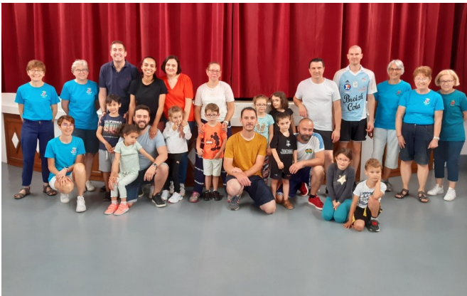
25 juin - Éveil : matinée parents-enfants