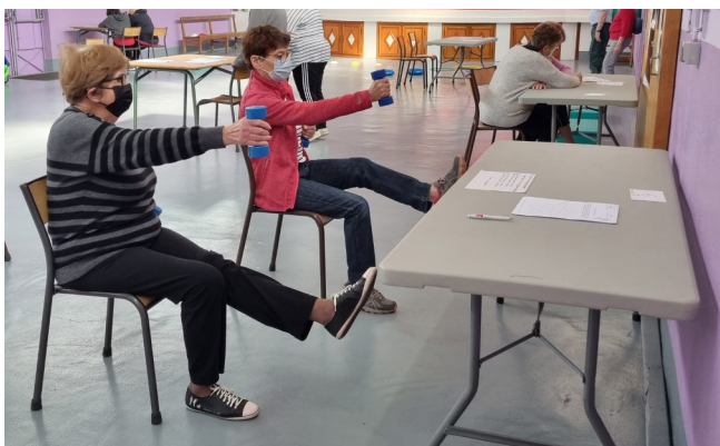
13 avril - Matinée Senior