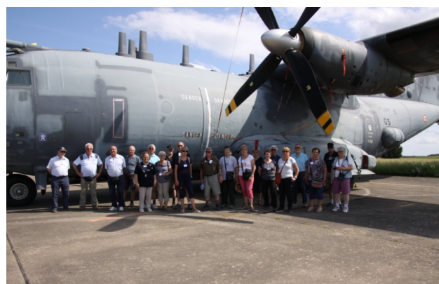
19 mai - Randonnée à Châteaudun