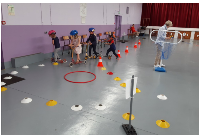
7 juin - Éveil : Code de la route