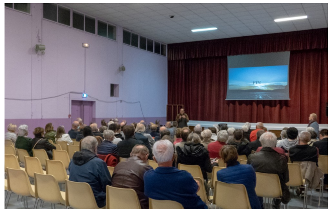
8 octobre - Soirée Photos