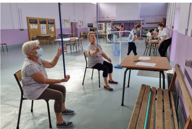
13 juillet - Matinée Senior