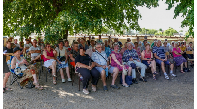
19 juin - Journée de fin de saison