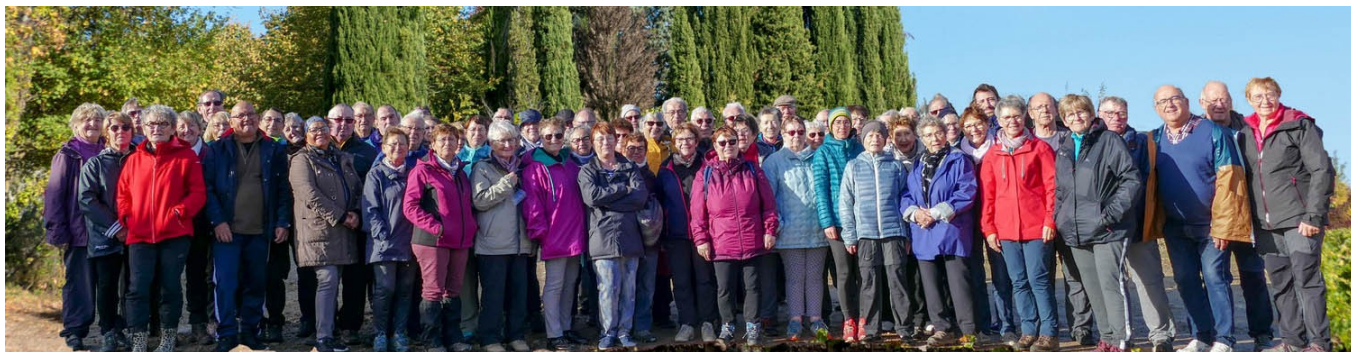
17 novembre - Randonnée Beaujolais nouveau