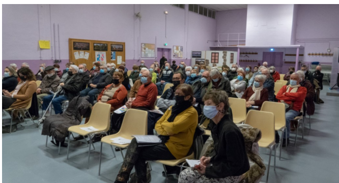
22 janvier - Assemblée Générale