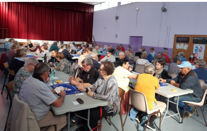
22 octobre - Concours de belote