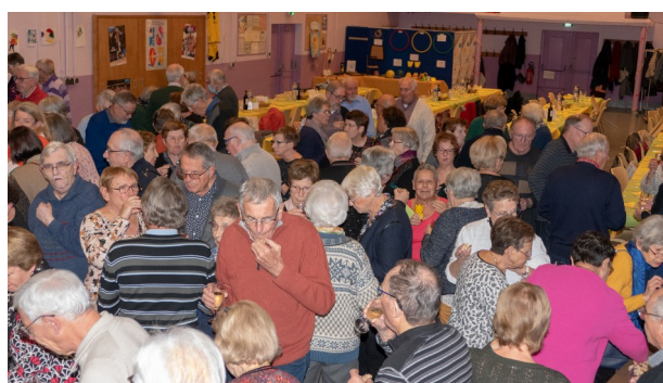
18 novembre - Soirée des adhérents