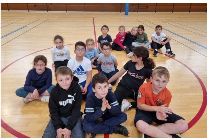
25 octobre - Stage Multi-activités