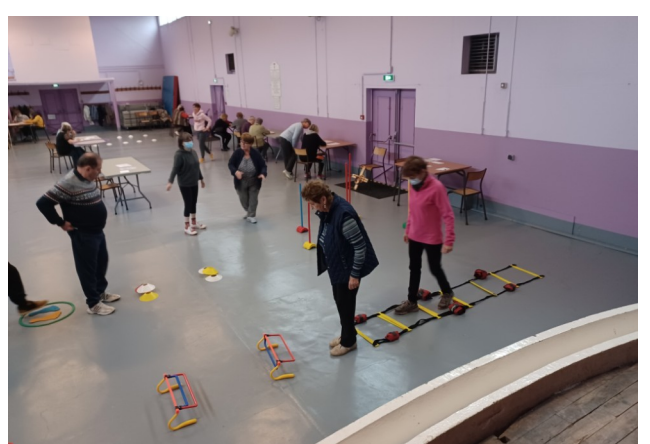
4 novembre - Matinée Senior