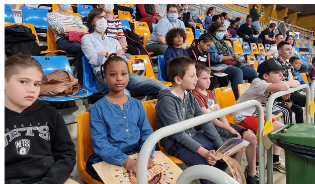
13 avril - Entraînement OLB