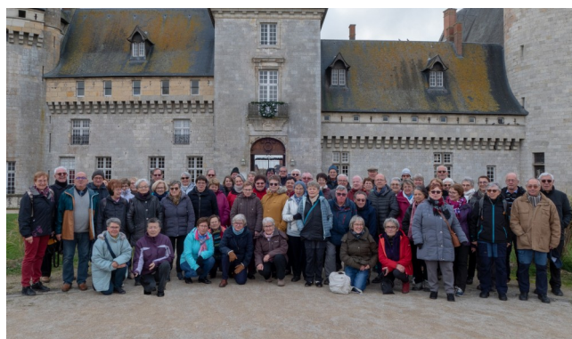
8 décembre - Rando-restaurant à Sully