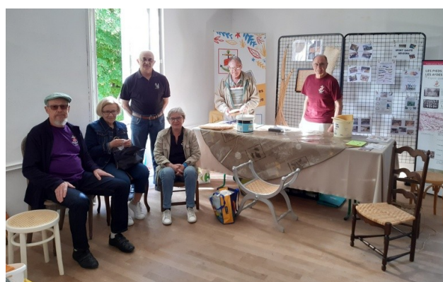
14 mai - Chevilly FSCF