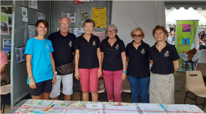
4 septembre - Rentrée en Fête