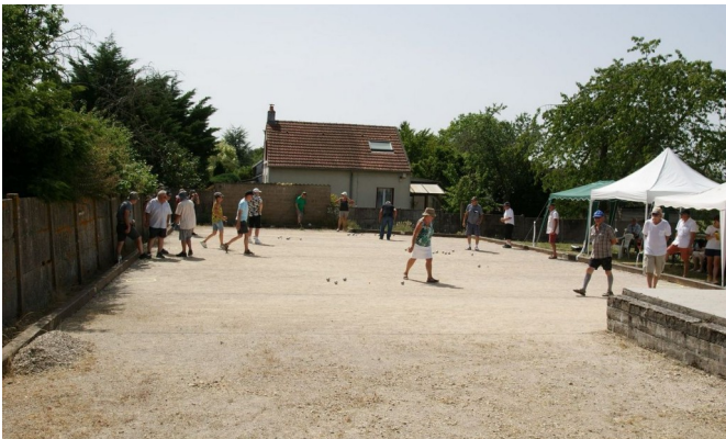
19 juin - Tournoi de pétanque