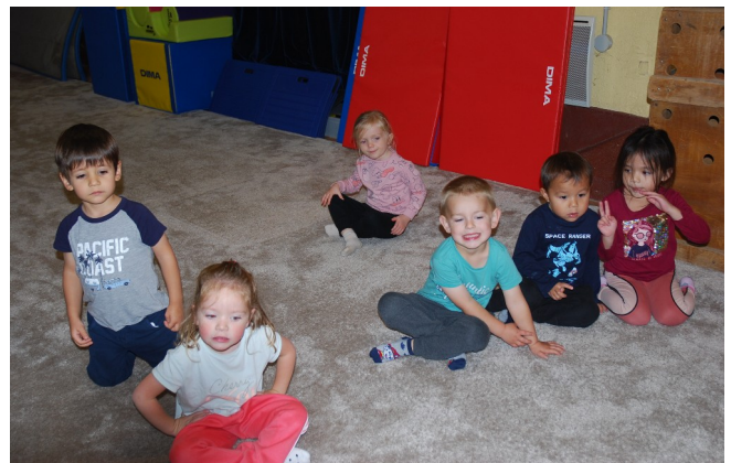
24 octobre - Stage éveil