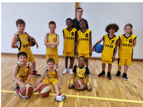
14 mai - Fête Mini-Basket