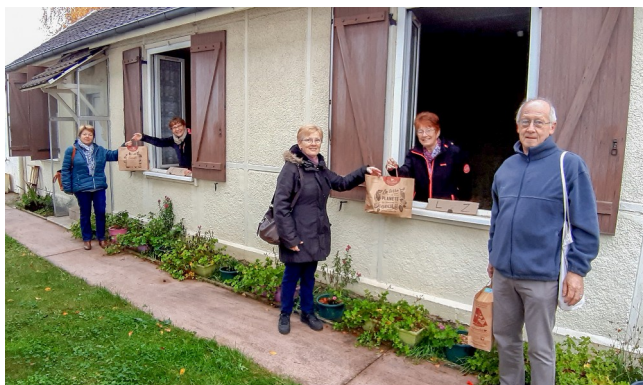
1er décembre - Opération chocolats