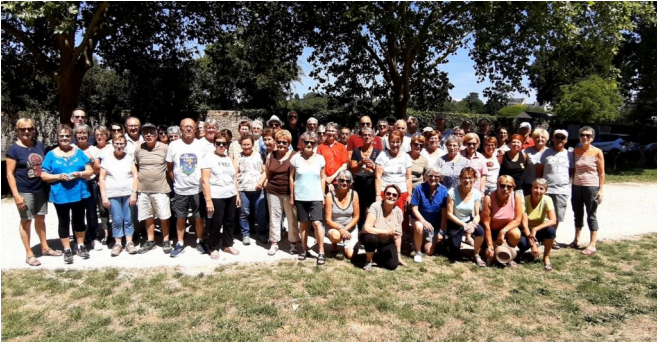
16 juin - Randonnée à Châteauneuf