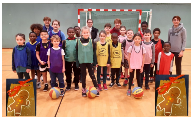
14 décembre - Kinder basket