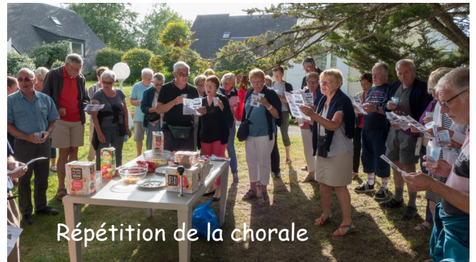
Répétition de la chorale