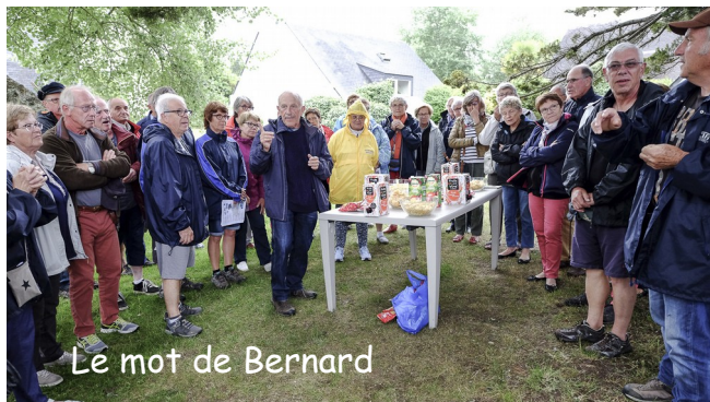
Le mot de Bernard