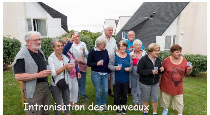
Intronisation des nouveaux