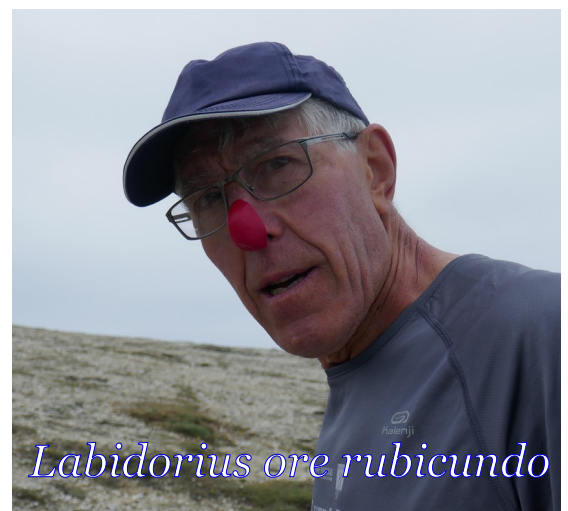
Labidiorius ore rubicundo